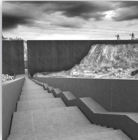
Monumentale Betontreppe und korrodierte Metallwand