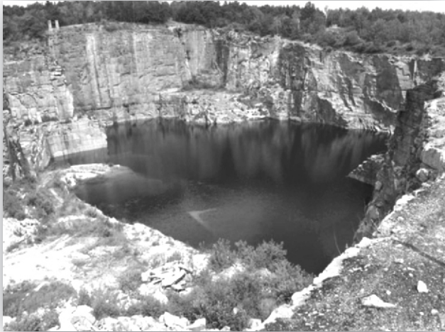
Steinbruch – Ort der Projektdurchführung (zeitgenössische Ansicht)